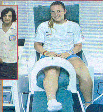
Em baixo: utilização de feixes de microondas (calor) para o relaxamento de alguns grupos musculares